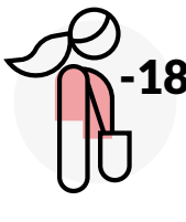
La vârstă minoră