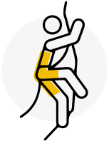
Activități de risc