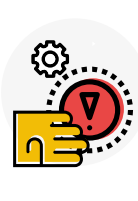
Muncă de precizie