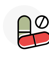
Anumite medicamente și boli