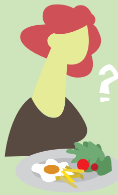
Pérdida de apetito

Si tienes tuberculosis, procura taparte la boca y la nariz al toser o estornudar, no escupir en el suelo, usar pañuelos desechables y eliminarlos adecuadamente y lavarte las manos frecuentemente con jabón.