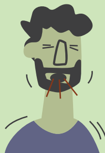
Tos más de 15 días

Puede pasar de una persona a otra por el aire, cuando una persona con tuberculosis tose o estornuda.