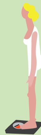
Pérdida de peso